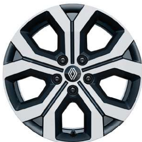
jantes alliage 17" diamantées