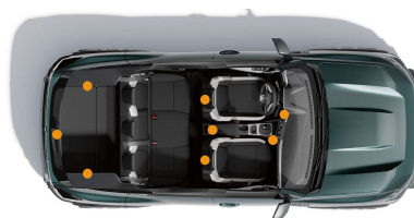
jusqu'à 8 points de fixation YouClip

Avec YouClip, disposez du plus malin des systèmes de fixation multi-usage pour accrocher les accessoires les plus variés disponibles dans la gamme, vous permettant de moduler votre Duster selon vos besoins. Ceux-ci se clipsent facilement sur jusqu'à 8 fixations réparties dans l'habitacle et le coffre.