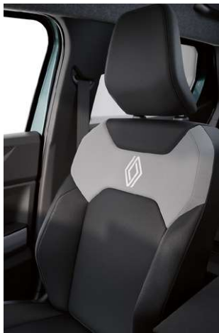
sièges mixtes noirs / kaki chiné avec surpiqûres noires et logo Renault