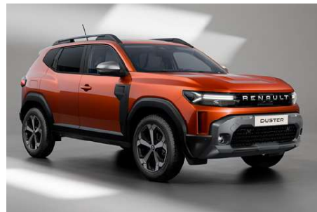
brun terracotta (m)