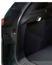
une lumière pour chaque recoin du véhicule

Pour encore plus de confort, un étonnant accessoire YouClip - 3 en 1 combine un porte-gobelet, une lampe et un crochet, qui peuvent être détachés et utilisés chacun à un endroit différent du véhicule ou en dehors.