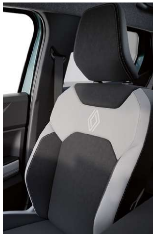
sièges mixtes gris en tissu raffiné / tissu noir avec marquage Renault et surpiqûres grises