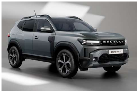
gris schiste (m)