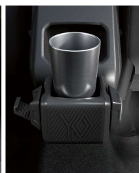
support multifonction 3 en 1