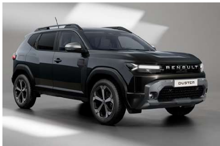
noir nacr   (m)