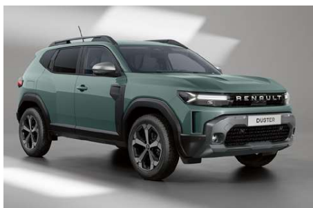
kaki lichen (o)

o: teinte opaque m: teinte m  tallis  e photos non contractuelles.