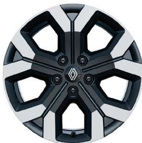
jantes alliage 17" semi-diamantées