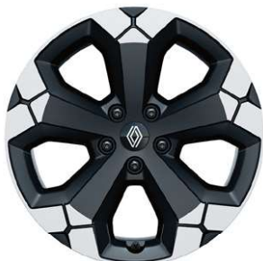
jantes alliage 18" semi-diamantées