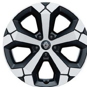
jantes alliage 18" diamantées