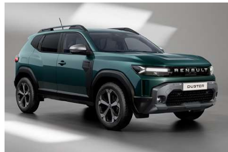
vert c  dre (m)