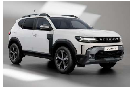
blanc glacier (o)